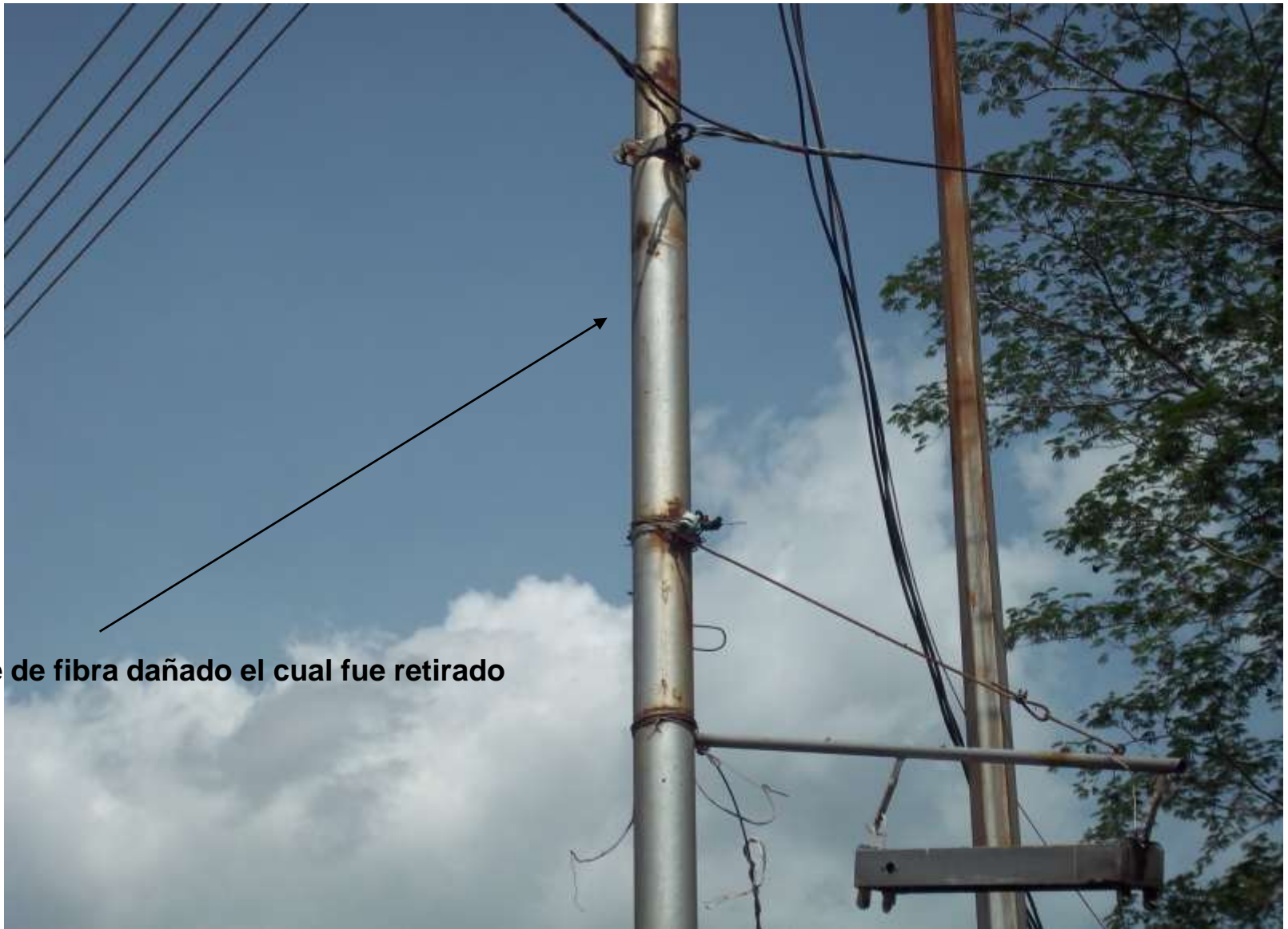
Cable de fibra dañado el cual fue retirado